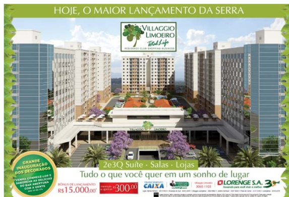
Anúncio Página Dupla