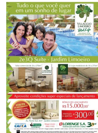
Anúncio 1 Página